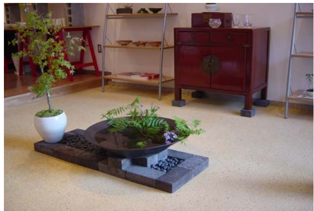
G-12(中国黄土) / さなげ石2分

※天然素材を使用のため写真と実物の色調が異なることがあります。予めご了承ください。