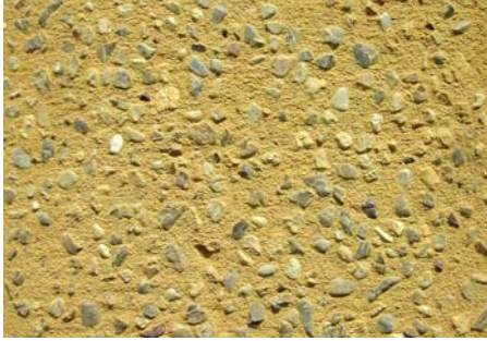
【G-2 (上州黄土) / さなげ石入り】 ブラッシング

天然土を主成分とする、‘叩き風’壁・床材「尾瀬の道」 天然原土の色合いなので色褪せがなく、 土ならではの通気性、調湿性を発揮します。