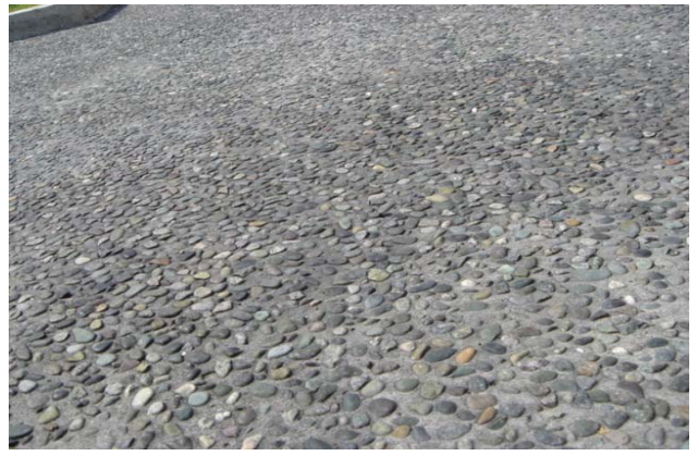
G-10(秩父釜土) / 大磯洗い出し