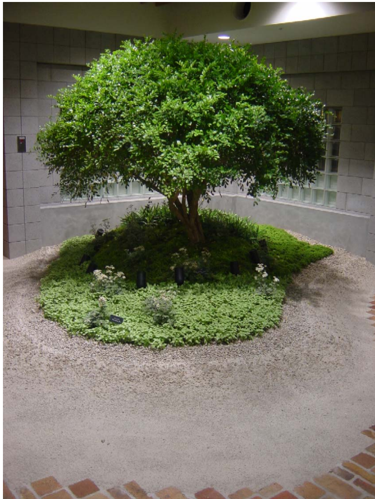
G-16 (鹿沼土) / 伊勢砂利30mm~1分 グラデーションブラッシング