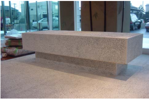
G-9(純白土) / 特黒2分ブラッシング