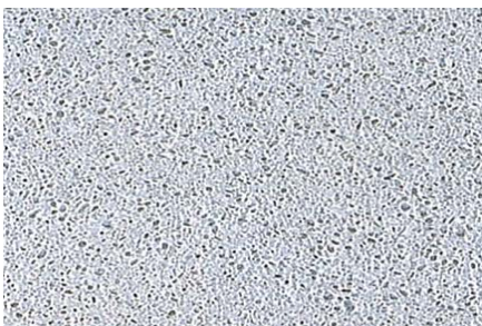
【G-9 (純白土) / ガラス・石入り】 ブラッシング