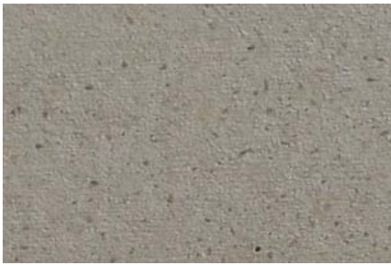
【川砂入り・特注色 / 金コテ押さえ】