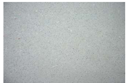
【G-3 (妙義白土) / 石入り】 研ぎ出し