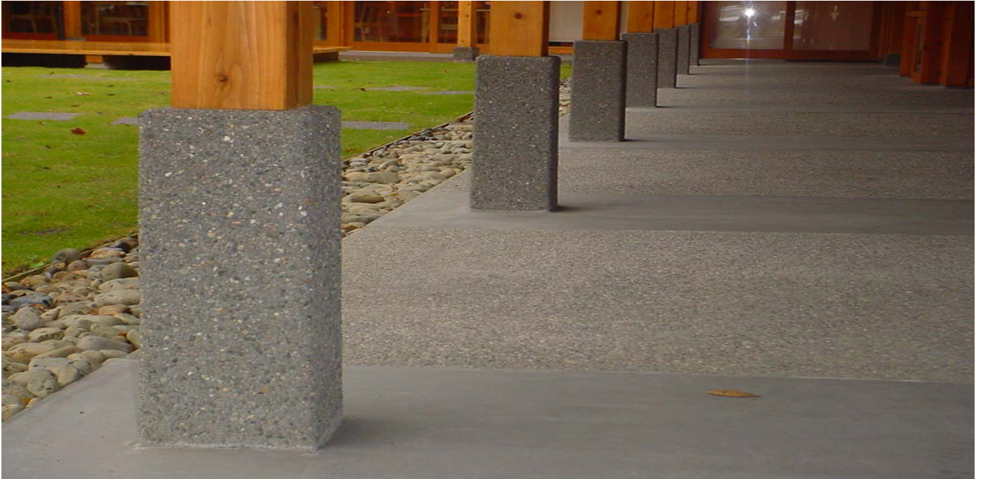
G-10(秩父釜土) / 豆砂利洗い出し