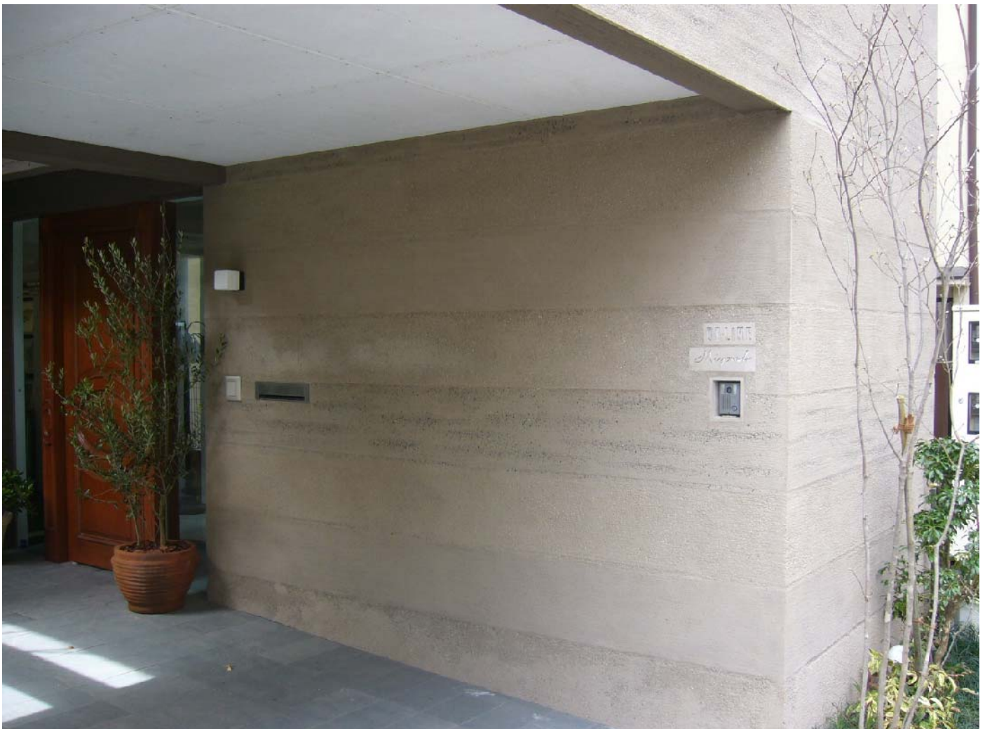
谷川Ⅰ大磯2分・川砂・茶仙2分 ブラッシング