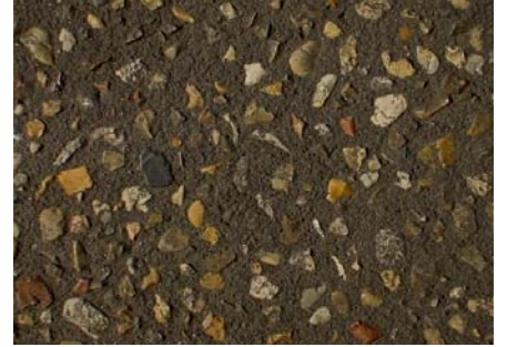
【特注色 (黒) / さなげ石入り】 ブラッシング