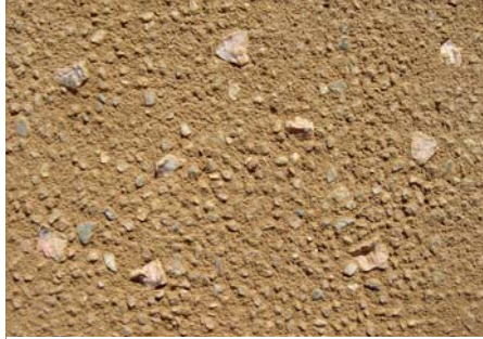
【G-7 (赤城の赤土) / 石入り】 ブラッシング