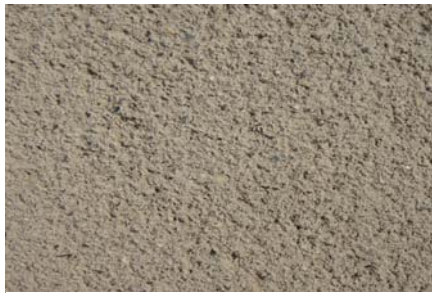
【川砂入り・特注色 / ブラッシング】