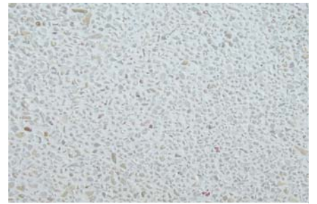
【G-9 (純白土) / サンゴ砂入り】 洗い出し