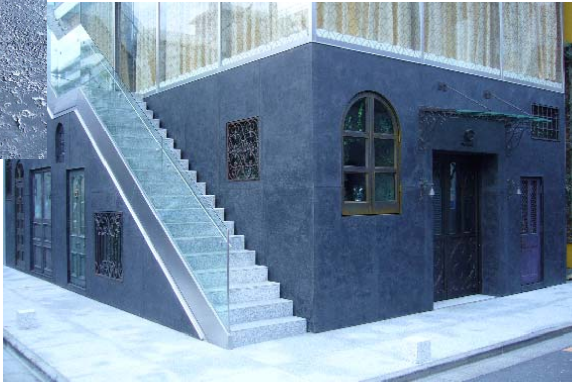
黒壁石植グラデーション