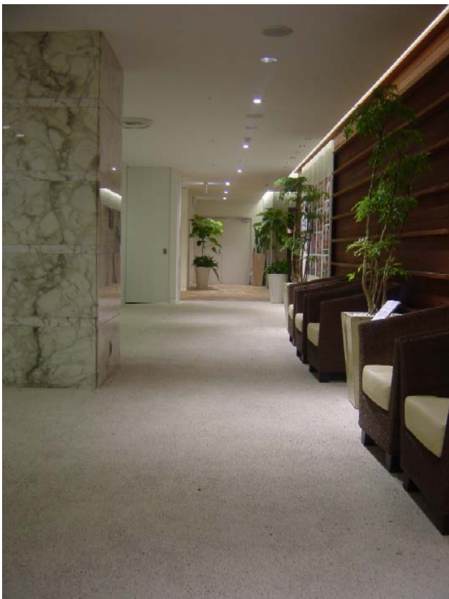
G-16 (鹿沼土) / 伊勢砂利2分 ブラッシング