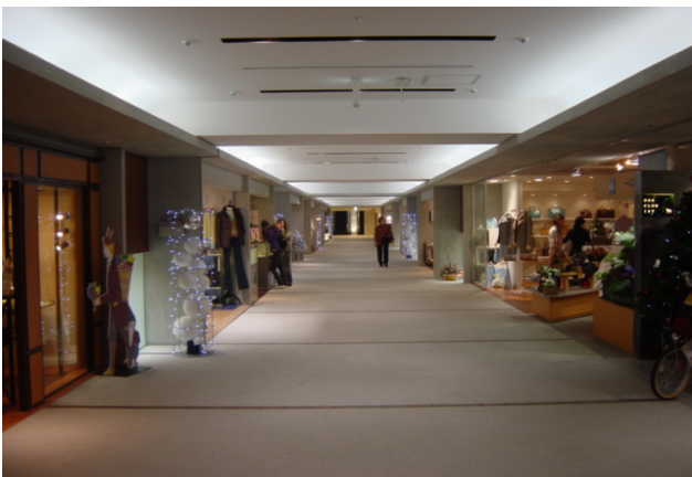
G-14(中土) / さなげ石2分