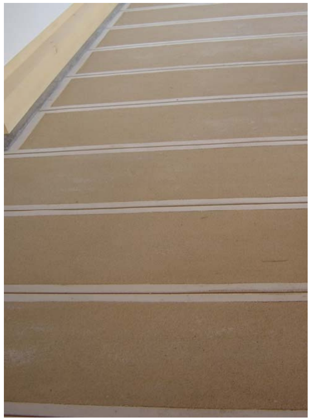
G-14 / さなげ石2分 金ゴテ ブラッシング