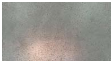
【 錫 】

天然の金属粉を使用した本物の質感、広い面積を目地なしで施工でき、曲面にも対応できます。