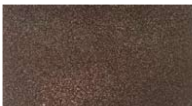
【 鉄錆磨き 】