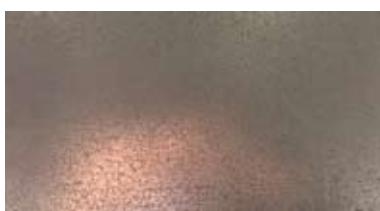
【 青銅 (S8020) 】