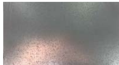
【 垂鉛 】