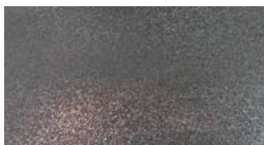
【 鉄 】